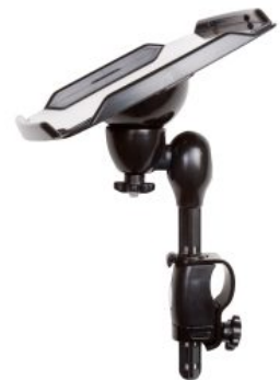
Mesa para comunicador Pacer