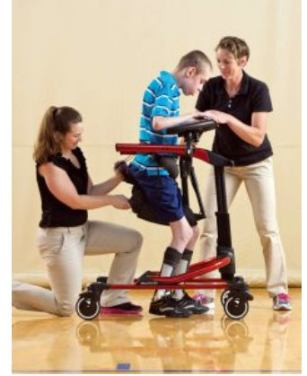
Bases Pacer Dinámico *Required