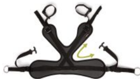
Soporte pélvico Pacer