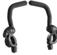
Barras de apoyo Pacer Dinámico