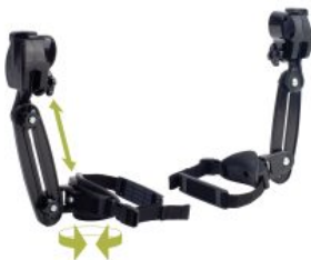
Soporte de muslo Pacer