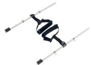
Soporte de tobillos Pacer