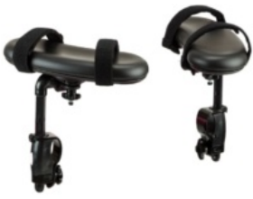
Soportes para antebrazos Pacer Dinámico