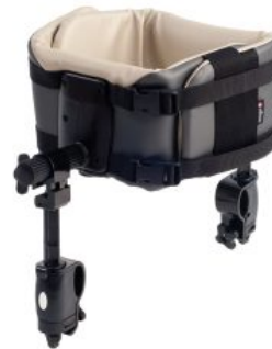
Soporte de tronco Pacer