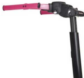
Chasis superior Pacer Dinámico *Required