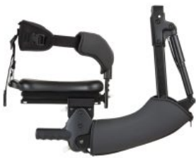
Sillín multiposicionador Pacer Dinámico