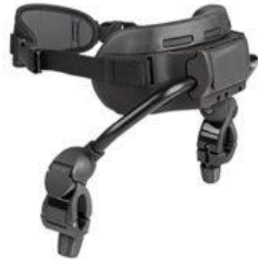
Soporte de pecho Pacer Dinámico