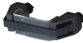
Suports toràcics alts Multistander