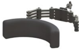
Suport postural multigrip Multistander