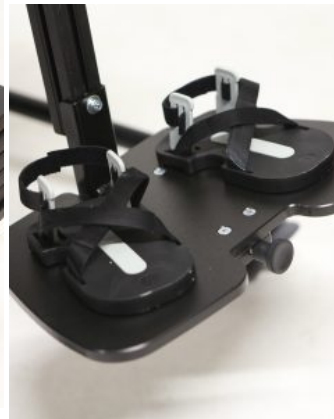
Sandalias Jenx (PAR)