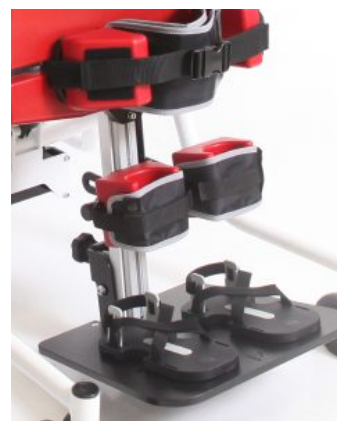
Soportes de rodilla Multistander