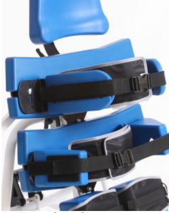
Soportes de cadera o tronco con cincha Multistander