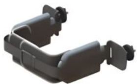
Soportes torácicos estrechos Multistander