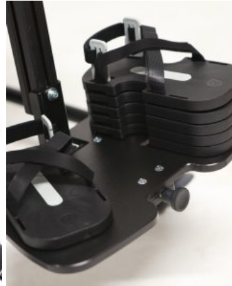
Bloques para una sandalia Multistander