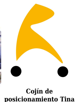
Cojín de posicionamiento Tina