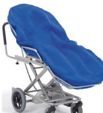
Colchón de vacío Tina