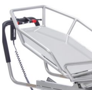
Bases para Tina *Required