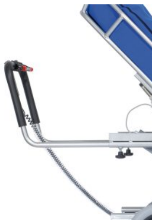
Extensión para empuñadura Tina