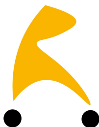
Funda transpirable Tina