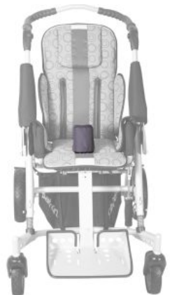
Taco abductor Tom 5