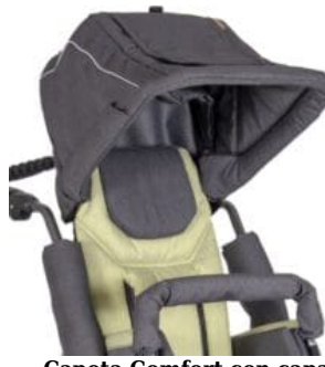
Capota Comfort con capa impermeable Patron