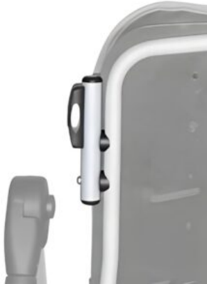
Posicionador ajustable para capota Tom 5