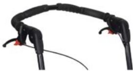
Freno tambor Tom 5