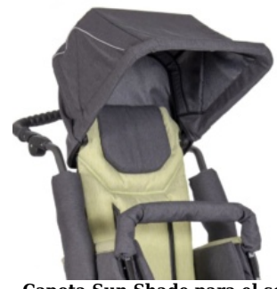
Capota Sun Shade para el sol Patron