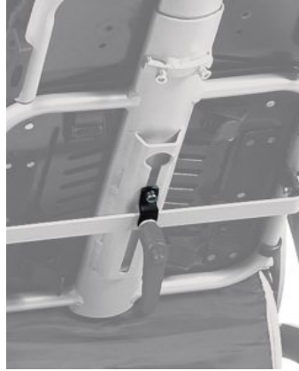
Fijación Reclinación para espásticos Tom 5