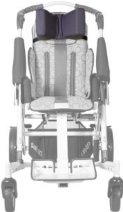
Reposacabezas en forma de «U» Tom 5