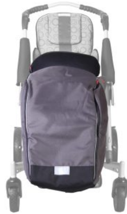
Saco de invierno Tom 5