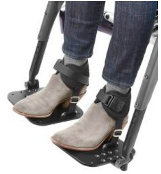
Cinchas de tobillo Ankle Huggers Bodypoint