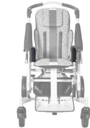
Protector soporte barra Tom5