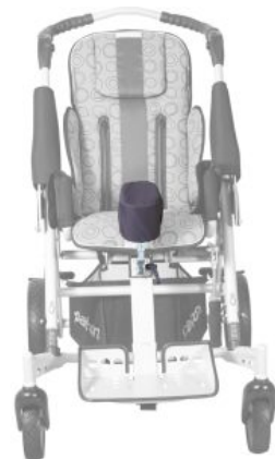
Separador de piernas Tom 5