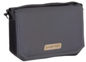
Bolso Jumbo Patron