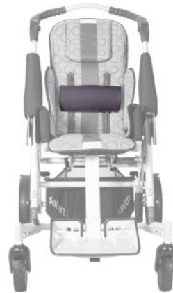
Soporte lumbar Tom5