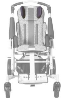
Soportes para la cabeza ( PAR) Tom5