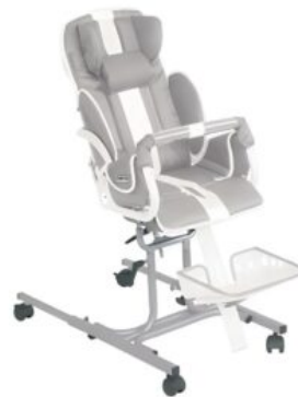
Chasis de interiores telescópico Tom 5