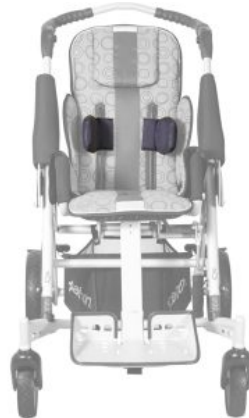
Soportes laterales de tronco (PAR) TOM 5