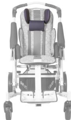
Soporte nuca Tom 5