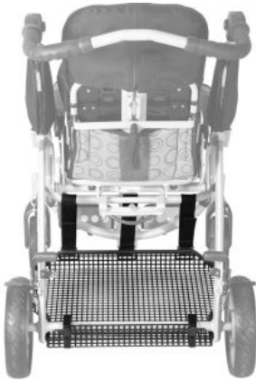
Cesta metálica Tom5