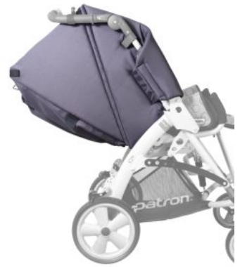
Extensión protector lateral Tom 5