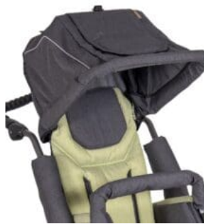
Capota Classic Patron