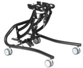
Chasis Denver Tom5