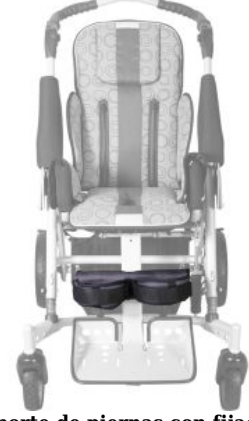
Soporte de piernas con fijación Tom 5