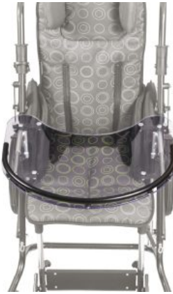
Mesita Tom 5