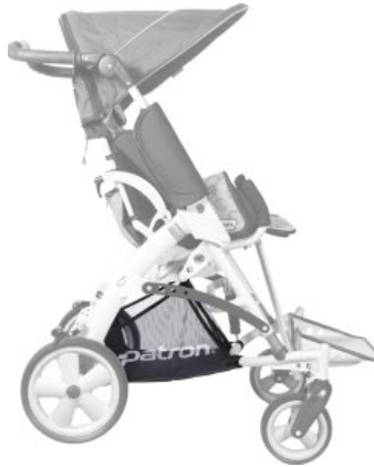
Cesta HD (alta densidad) Tom 5