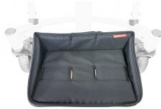
Acolchado reposapiés Tom 5