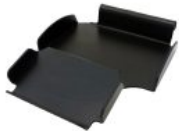
Bandeja para respirador Bingo/Bingo OT