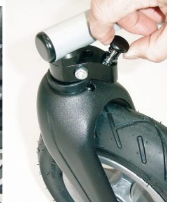
Bloqueo de dirección Bingo/Bingo OT