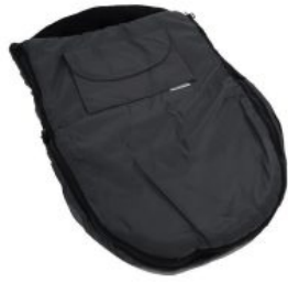
Saco para invierno Hoggi