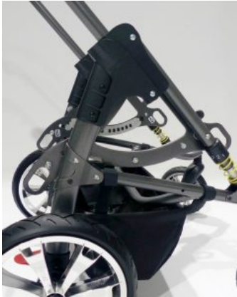
Kit anclaje para vehiculo Bingo/Bingo OT