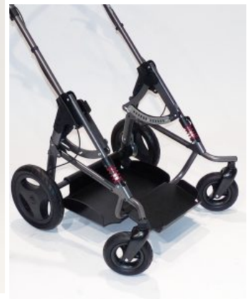
Ruedas PU Bingo / Binto OT