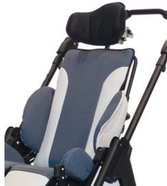
Reposacabezas ajustable Bingo OT