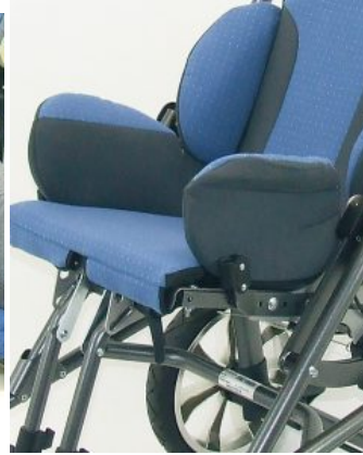
Soportes pélvicos ajustables Bingo/Bingo OT