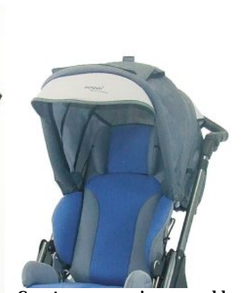
Capota con capa impermeable Hoggi