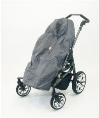
Capa impermeable Hoggi