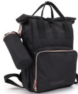
Bolso color negro Hoggi