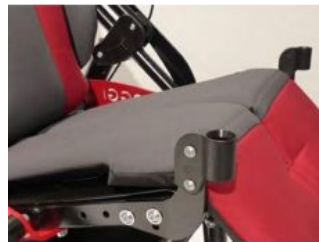
Soporte para barra o mesa terapéutica Hoggi