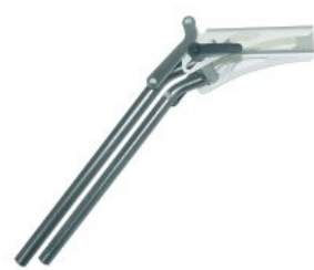
Reposapiés elevables Bingo/Bingo OT