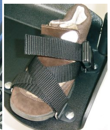
Cincha para pies (PAR) Hoggi