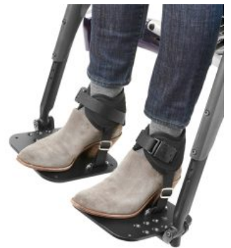
Cinchas de tobillo Ankle Huggers Bodypoint