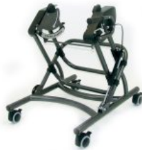
Chasis de interior Cobra para Bingo/Bingo OT