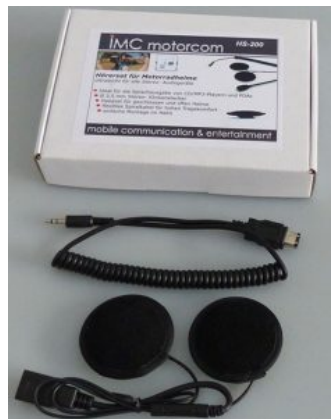
Altavoces para soporte de cabeza Hoggi