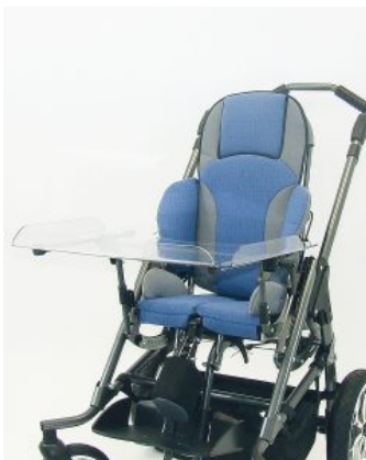
Mesa terapéutica Hoggi