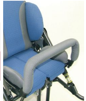
Barra delantera con funda Hoggi