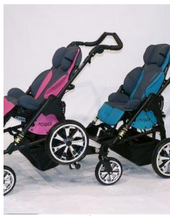
Kit de conexión Bingo Duo