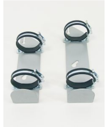
Soporte de oxígeno para botellas Bingo/Bingo OT