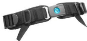
Cinturón pélvico 4 puntos Bodypoint