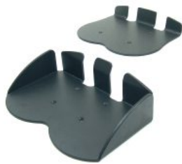
Bloqueo plataforma reposapiés Bingo/Bingo OT