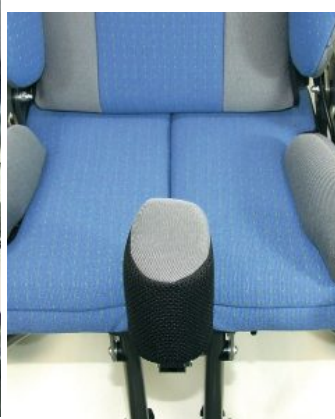
Taco abductor Hoggi