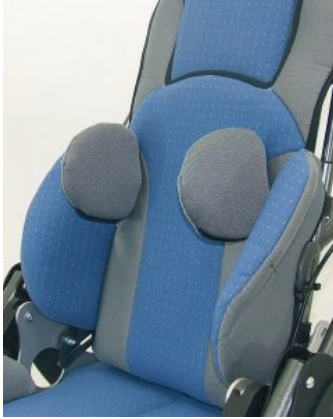
Soportes de tronco ajustables Hoggi