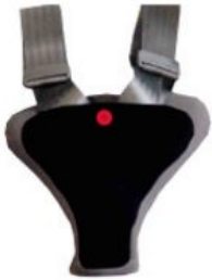
Protector de seguridad Hernik