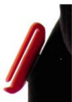
Guía de cinturón adicional Kidsflex