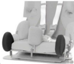
Soporte de pierna Kidsflex