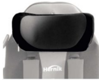
Soporte de cabezas Kidsflex