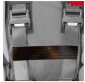
Cinturón conexión cinchas pecho Hernik