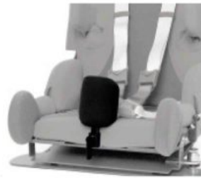
Taco abductor extraíble Kidsflex