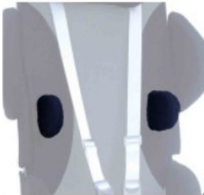
Soportes de tronco Kidsflex