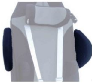
Soportes de hombro Kidsflex