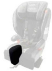
Taco abductor extraíble Starfight-Nxt