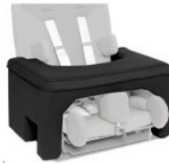
Mesa de seguridad Starfight-Nxt