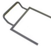
Arco de estabilización Starfight-Nxt