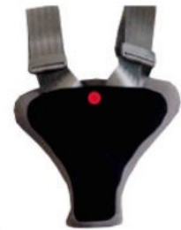
Protector de seguridad Hernik