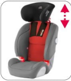
Kit XL Starfight-Nxt