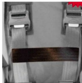
Cinturón conexión cinchas pecho Hernik