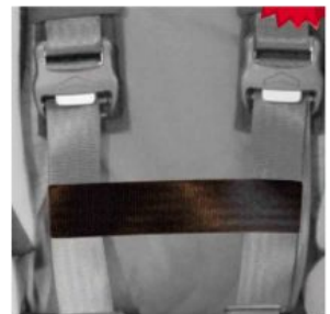
Cinturón conexión cinchas pecho Hernik