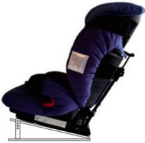
Base ajustable en inclinación Ipai-Nxt