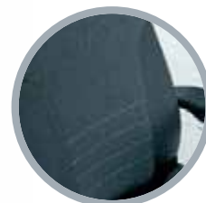
Opcional: Tapicería de Cordura

El modelo Tracer incorpora motores de última generación. Tanto el modelo de 200 vatios como el de 350 vatios les permiten subir cuestas sin dificultad.