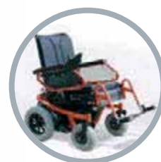
Modelo Tracer GT

Pero esto no es todo. El control se puede programar para cubrir sus necesidades personales. Velocidad, aceleración y sensibilidad del joystick: tres parámetros programables para su comodidad.