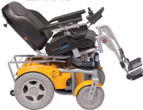
BASCULACIÓN Y RECLINACIÓN