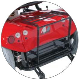
ANTIVUELCOS Y PORTAEQUIPAJE DE SERIE