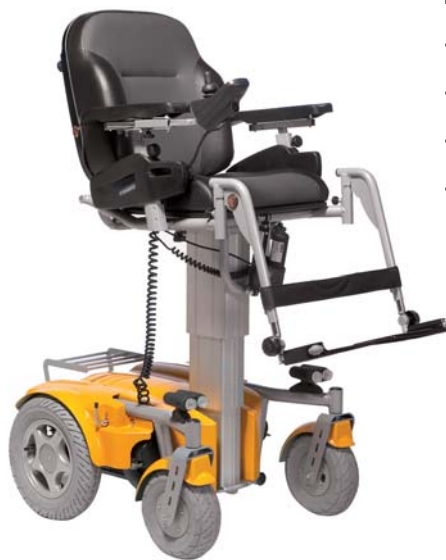
ELEVACIÓN DE ASIENTO

Silla electrónica de 10 km/h, equipada de serie con unos motores de 350W, electrónica DX2 Dynamic Control, 2 baterías de 73 Ah, reposabrazos regulables en altura y en anchura, portaequipajes, respaldo reclinable manualmente por puntos hasta 30° y asiento basculante por puntos hasta 15°.