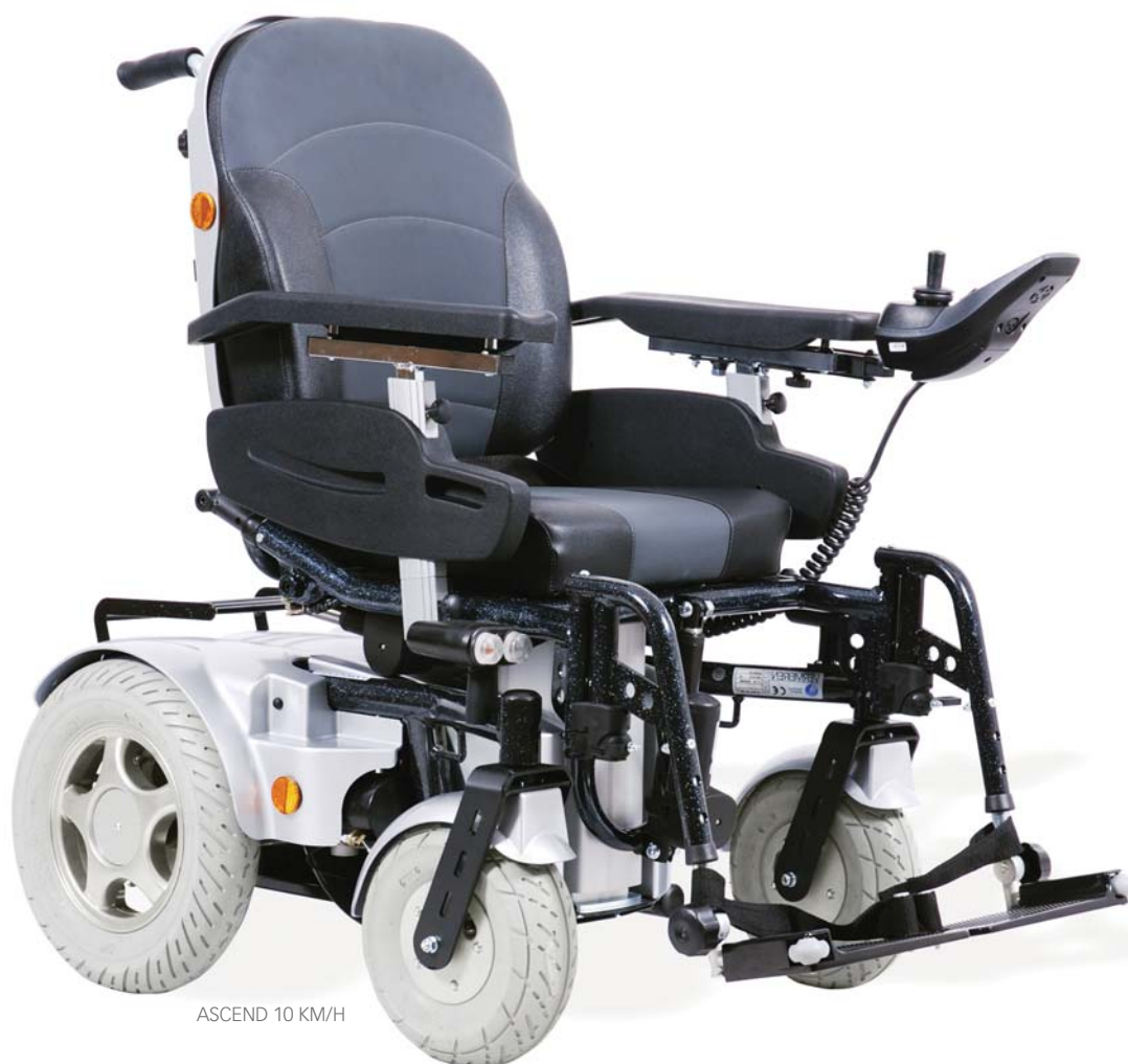
ASCEND 10 KM/H