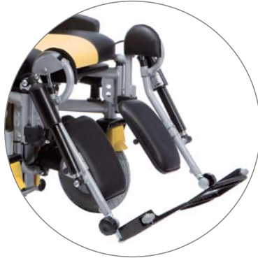
OPCIÓN: REPOSAPIERNAS ELEVABLES ELÉCTRICAMENTE BZ7E