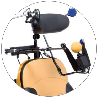
OPCIÓN: MANDO MENTÓN