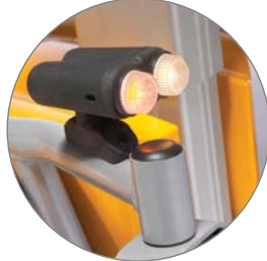
LUCES (DE SERIE)