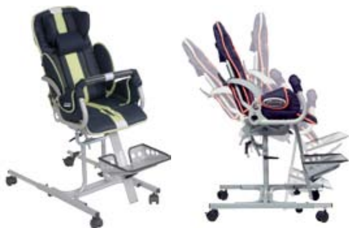
CHASIS PARA INTERIORES. MANIOBRABILIDAD EN PEQUEÑOS ESPACIOS