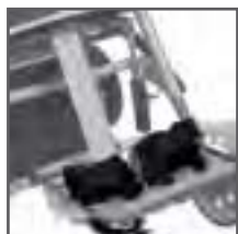
CINTURÓN PARA LOS PIES