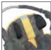
SOPORTES PARA LA CABEZA (PAR)