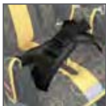
FIJACIÓN PÉLVICA CONFORT