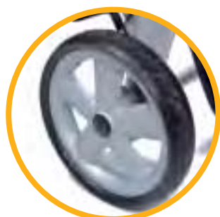
RUEDAS MACIZAS DE PERFIL BAJO