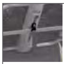
FIJACIÓN RECLINACIÓN PARA ESPÁSTICOS