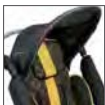
CAPOTA PARA EL SOL