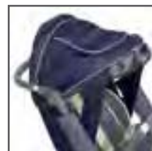
CAPOTA CON CAPA IMPERMEABLE