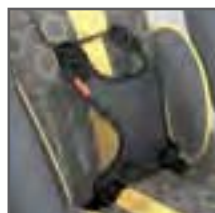
PETO FIJACIÓN CONFORT