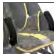
PROTECTOR SOPORTE BARRA FRONTAL