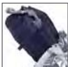
EXTENSIÓN PROTECTOR LATERAL