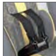
CINTURÓN 4 PUNTOS CONFORT