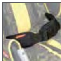
CINTURÓN 2 PUNTOS CONFORT