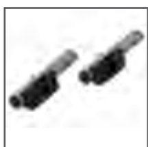
POSICIONADOR AJUSTABLE PARA CAPOTA