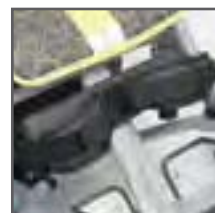
SOPORTE DE PIERNAS CON FIJACIÓN