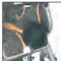
SEPARADOR DE PIERNAS