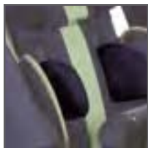
SOPORTES LATERALES DE TRONCO (PAR)