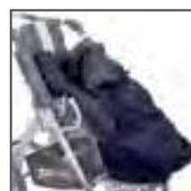
SACO DE INVIERNO