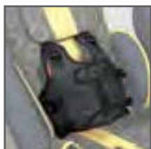
CHALECO FIJACIÓN CONFORT