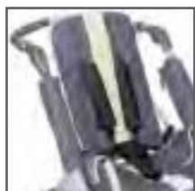
CINTURÓN 5 PUNTOS